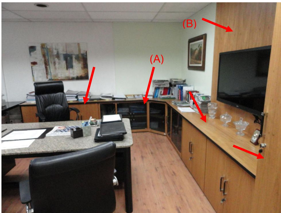
Foto 01 – Móvel de madeira, acabamento freijó, a ser desmontado e posteriormente remontado.