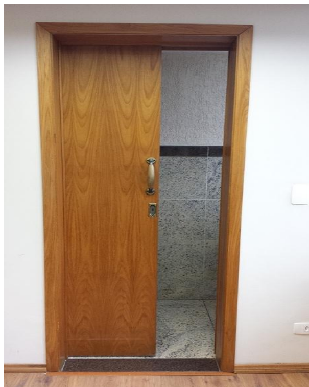
Foto 06 – Referência para acabamento das novas portas – padrão freijó natural.