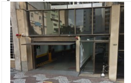
Figura 7: Acesso prédio Anexo II - Rua Dr. Bitencourt Rodrigues