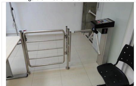
Figura 3: Prédio Anexo II – Protocolo

2.4. As catracas apresentam as seguintes características: